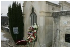
MÉDIAS Hollande et Chirac, tête-à-tête secret à Jarnac!