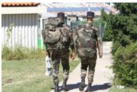
BRIE Obsèques à Brie du 7e soldat français mort au Mali