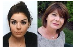
FRANCE Perpignan : le père des deux disparues retrouvé pendu [Vidéo]