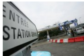
LUNESSE Braquage au couteau à la station-service de Lunesse